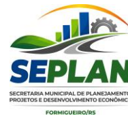
TABELA DE EMENDAS IMPOSITIVAS 2026 – ENTIDADES

Secretaria de Planejamento, Projetos e Desenvolvimento Econômico